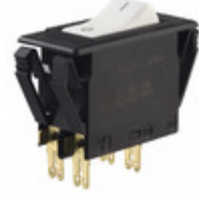
3120-F321-P7T1-W02D-20A E-T-A CIR BRKR THRM 20A 250VAC 50VDC