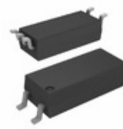
FOD8321R2V Fairchild/ON Semiconductor OPTOISO 5KV GATE DRIVER 5SOP