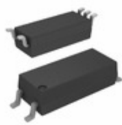
FOD8320V Fairchild/ON Semiconductor OPTOISO 5KV GATE DRIVER 5SOP