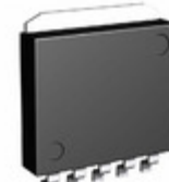
BA33D18HFP-TR Rohm Semiconductor IC REG LDO 3.3V/1.8V 0.5A HRP5