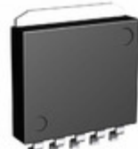
BA33DD0WHFP-TR Rohm Semiconductor IC REG LDO 3.3V 2A HRP5