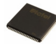
A42MX09-2PL84I Microsemi Corporation IC FPGA 72 I/O 84PLCC