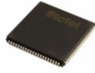
A42MX09-2PLG84 Microsemi Corporation IC FPGA 72 I/O 84PLCC