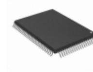
A42MX09-2PQG100 Microsemi Corporation IC FPGA 83 I/O 100QFP