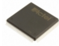
A42MX09-2PQ160 Microsemi Corporation IC FPGA 101 I/O 160QFP