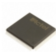
A42MX09-2PQ160I Microsemi Corporation IC FPGA 101 I/O 160QFP