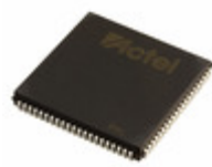
A42MX09-2PL84 Microsemi Corporation IC FPGA 72 I/O 84PLCC