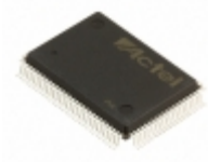
A42MX09-2PQ100I Microsemi Corporation IC FPGA 83 I/O 100QFP